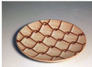
167 28-130120 在庫475 網6.0皿 ¥700 19×2.3cm