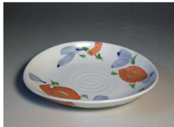
166 35-130127 在庫119 いろどり楕円6.0皿(強化) ¥2,600 19.4×18×2.9cm