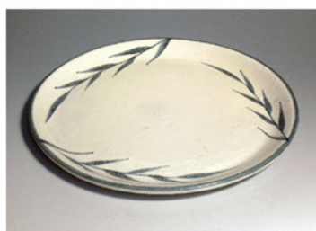
178 73-150123 在庫22 布目笹7.0丸皿 ¥1,350 23.5×2cm