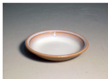
176 26-150101 在庫144 あすか3.5皿 ¥500 10.5×2cm