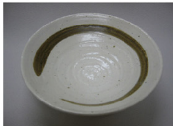
171 75-130120 在庫160 茶刷毛白丸皿 ¥2,400 17×5.2cm