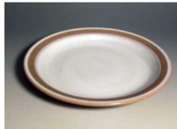
168 26-130103 在庫317 あすか6.0皿 ¥830 19×3cm