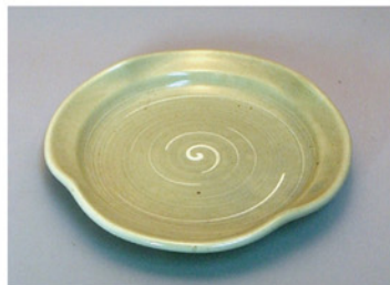
170 52-130104 在庫26 益子渦四ツ押和皿(強化) ¥1,000 17.1×2.8cm