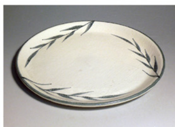
177 73-150122 在庫31 布目笹8.0丸皿 ¥2,000 26.5×2cm