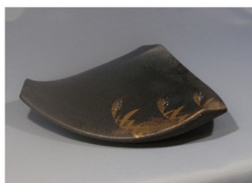
179 55-150169 在庫24 金ススキ7.0口変り皿(強化) ¥3,550 20.5×4.5cm