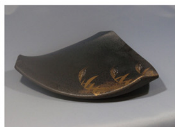
180 55-150170 在庫90 金ススキ5.5前菜皿(強化) ¥2,800 16.0×4.5cm