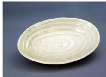
164 65-130103 在庫25 うずしお小判皿 ¥650 20×14×3.8cm