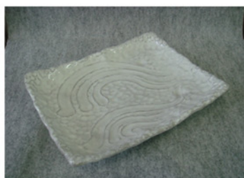
173 81-140107 在庫28 白釉10号足付長角皿 ¥1,500 30.7×24.7×5cm