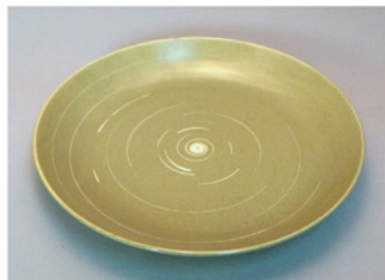
163 52-130106 在庫32 益子渦7.0皿(強化) ¥1,300 21.7×3cm