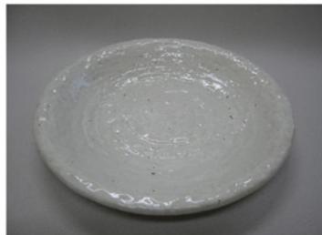
165 75-130165 在庫300 石目19.8cm丸皿 ¥1,000 19.7×2.5cm