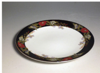
162 36-130108 在庫180 牡丹22cm皿 ¥400 22×2cm