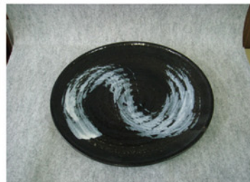
172 81-140108 在庫30 黒釉刷毛目11号丸皿 ¥1,800 33×3cm