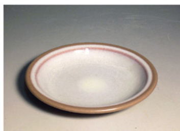
175 26-150102 在庫192 あすか5.0皿 ¥660 15.8×2.4cm