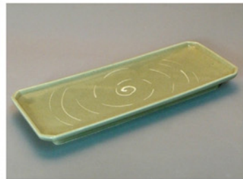
248 52-190102 在庫54 益子渦付皿(強化) ¥1,300 22.8×8.4×2.5cm