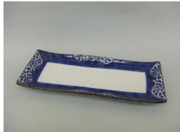
243 71-190114 在庫48 藍唐草突出皿 ¥800 25×10.3×2.6cm