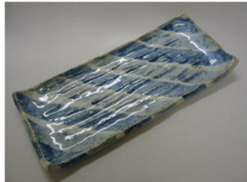
242 75-190119 在庫60 染分けカク彫り突出皿 ¥2,400 26×11×2.5cm