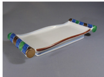
252 55-190180 在庫90 三彩交趾突出皿 ¥1,850 21.5×9.0×3.5cm