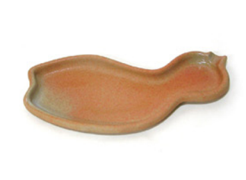
249 21-190104 在庫40 備前風ひさご型付皿 ¥1,200 22.5×9.5×2.8cm