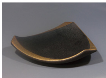
259 55-190166 在庫40 三つ切削金黒前菜皿 ¥1,650 16.0×5.0cm