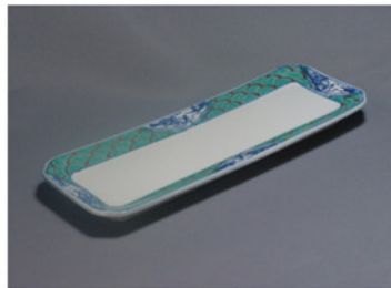
246 55-190135 在庫54 青海波山水突出皿 ¥1,600 24.6×9.0×cm