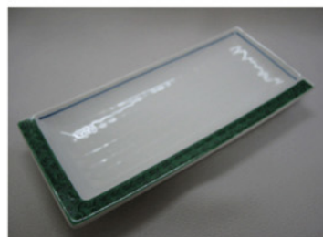
257 75-190159 在庫60 グリーン交趾突出皿 ¥1,000 20×12.5×2.5cm