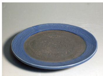
258 58-190109 在庫65 ルリ銀彩6.0丸皿(強化) ¥2,200 18×2.5cm