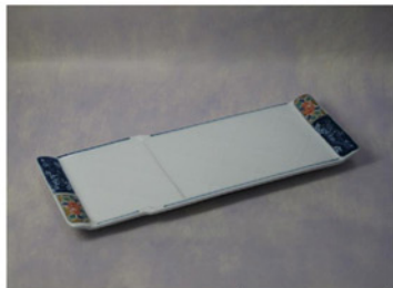
245 53-190108 在庫32 間取金牡丹突出皿 ¥1,400 25×9.5cm