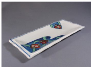
253 55-190183 在庫120 染錦山茶花突出皿 ¥2,400 21.0×9.0×2.0cm