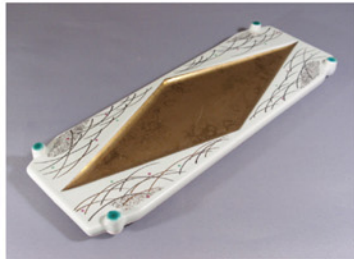
241 55-190151 在庫73 金箔八つ橋突出皿 ¥2,500 26.6×9.4×1.6cm