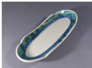
254 55-190190 在庫63 金彩牡丹突出皿 ¥2,100 21.0×7.8×2.0cm