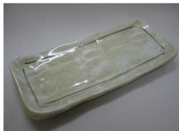
255 75-190123 在庫45 雲海7寸角皿 ¥1,400 21×9.5×2cm