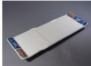
244 55-190127 在庫76 間取金牡丹突出皿 ¥1,400 25.0×9.5×2.0cm