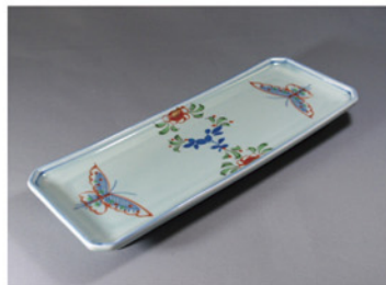
250 55-190196 在庫70 古染蝶突出皿 ¥1,750 22.3×8.4×2.3cm