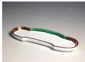
256 28-190104 在庫198 松型突出皿 ¥1,500 20×7×2cm