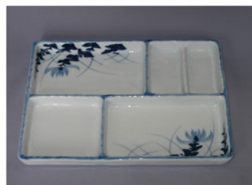
260 72-200106 在庫62 菊絵弁当皿 ¥1,980 27.5×20×2.5cm