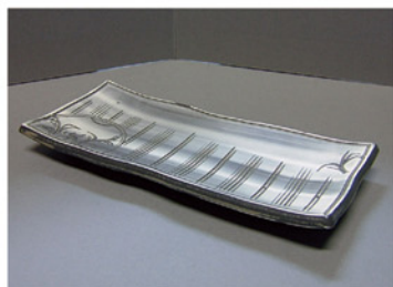
549 01-190262 在庫53 十五夜突出皿 ¥2,100 12.5×9.6×2.6cm