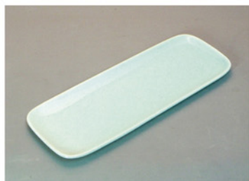
541 52-190217 在庫46 青磁付出皿 ¥700 20.7×8×1.3cm