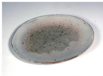
546 05-190214 在庫23 不動窯唐津化粧吹き楕円皿 ¥1,800 17×14.5×2cm