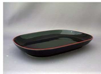
552 03-200231 在庫90 レッドライン多用皿 ¥1,000 23.4×15.3×3.2cm