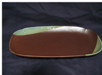
551 79-200203 在庫45 南蛮つどい9.0小判皿 ¥1,500 25×16×2cm