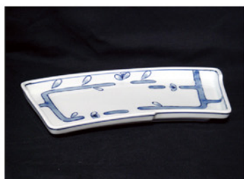
553 79-200208 在庫80 舞梅 付出皿 ¥700 23×10×3.1cm