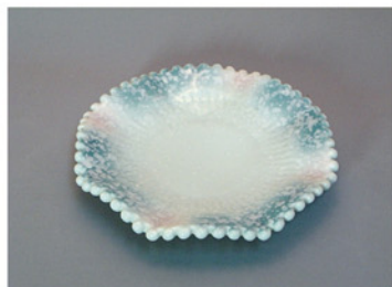
545 52-190308 在庫68 玉澗波しぶきフルーツ皿 ¥1,000 17.8×16.9×3.3cm