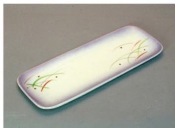
542 52-190218 在庫45 紫吹武蔵野付出皿 ¥800 20.7×8×1.3cm