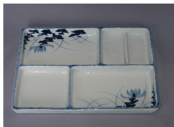
550 72-200106 在庫52 菊絵弁当皿 ¥1,980 27.5×20×2.5cm