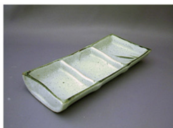
555 03-200230 在庫23 白唐津三ツ切皿 ¥500 21×9.3×2.9cm