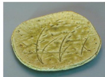
548 52-190307 在庫22 古陶灰釉前菜皿(手造り) ¥1,600 16.5×2.6cm