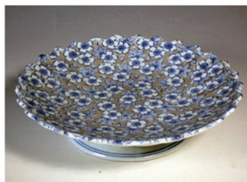
543 58-190205 在庫55 銀彩春秋菊型6.5皿 ¥2,500 20×5cm