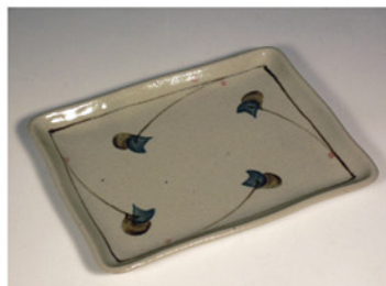
547 05-190230 在庫100 不動窯やすらぎ6.5角皿 ¥1,400 16.5×13×1.3cm