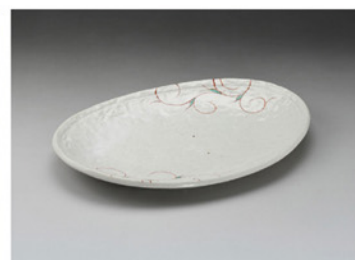
556 25-200213 在庫104 唐草楕円皿 ¥1,350 21×15×2.5cm