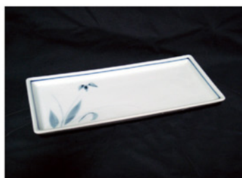
554 79-200201 在庫83 くし目ラン 付出皿 ¥500 21.8×10×2.4cm