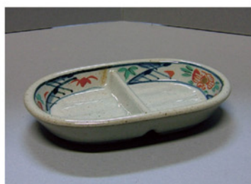
558 01-200244 在庫45 赤絵花鳥二つ切薬味皿 ¥2,300 14×9.4×2.8cm