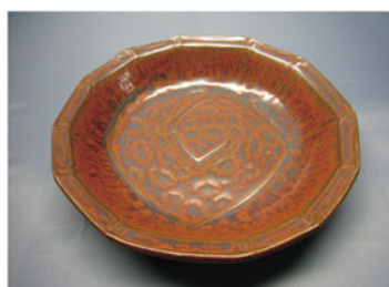
559 62-210116 在庫118 うるし赤マツ竹彩6.5深皿 ¥440 19.9×4.1cm