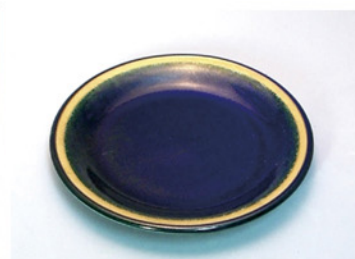
560 52-210310 在庫56 ルリ金線彩6.0皿(強化) ¥1,200 19×2.2cm