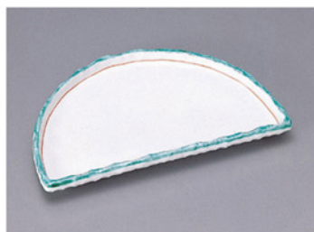
375 75-150324 在庫33 緑交趾半月皿(大) ¥1,200 25×15.3×2.3cm