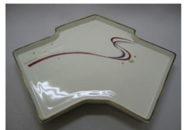
372 75-150143 在庫22 京紫帯流水家形突出皿 ¥400 19×14×1.5cm