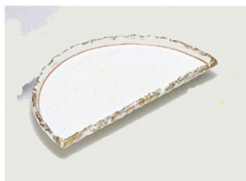
374 75-150323 在庫35 金タタキ半月皿(中) ¥800 22.3×21.1×2.1cm