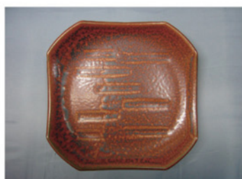
379 62-160114 在庫70 うるし赤マット7.5京四方皿 ¥710 22.4×3.2cm