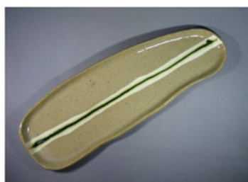
377 72-160324 在庫19 織部ライン変形皿 ¥1,980 37.4×12.5×2.3cm