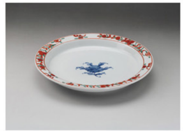
364 25-150205 在庫54 赤絵万暦6.0皿 ¥2,340 18.3×3cm