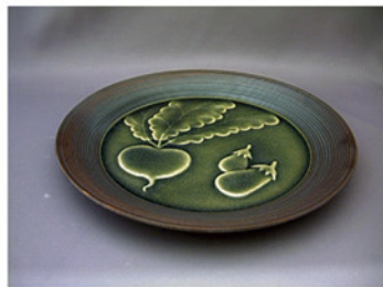
363 03-130223 在庫81 野菜パープル6.0皿 ¥800 18.7×2cm