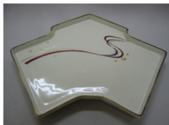
371 75-150142 在庫110 京紫帯流水家形焼物皿 ¥400 26.5×17.5×2cm