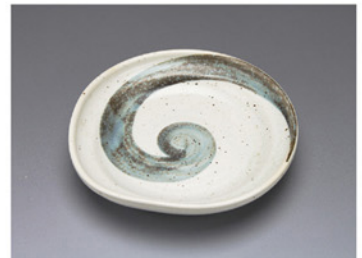
368 52-130361 在庫60 粉引ウズ片口5.5皿 ¥550 16.7×16.4×3.3cm