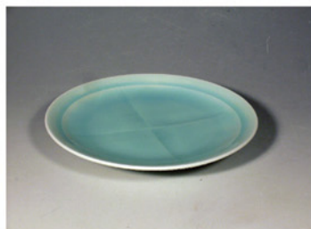
369 57-130309 在庫110 青白磁5.0皿 ¥850 16×2.5cm