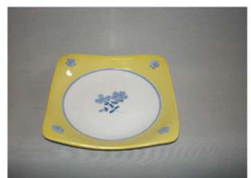
380 37-160304 在庫150 黄彩花7.0角皿 ¥540 21.5×17.5×3.5cm