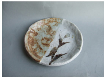
365 71-130304 在庫22 錆芦6.0皿 ¥1,000 18.2×2.3cm