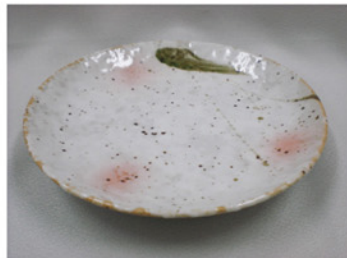
367 75-130208 在庫29 萩志野丸皿 ¥300 16.8×3cm