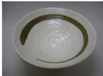
366 75-130120 在庫160 茶刷毛白丸皿 ¥840 17×5.2cm