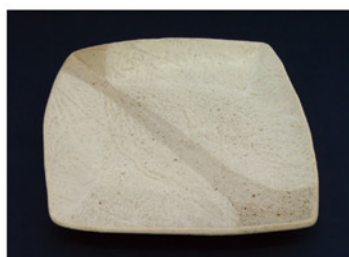
378 55-160335 在庫15 リップル変形正角皿(大) ¥2,300 24×23.4×3.5cm