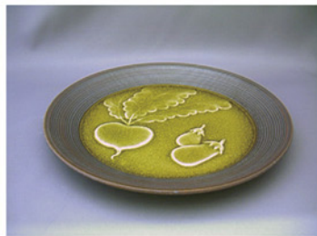
361 03-130221 在庫58 野菜イエロー6.0皿 ¥800 18.7×2cm