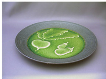
362 03-130222 在庫117 野菜グリーン6.0皿 ¥800 18.7×2cm