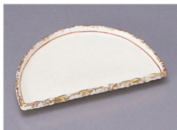
373 75-150322 在庫48 金タタキ半月皿(大) ¥1,200 25×15.3×2.3cm