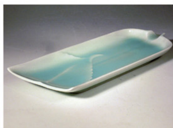
449 57-190320 在庫48 青白磁突出皿 ¥2,000 24×10×2.7cm