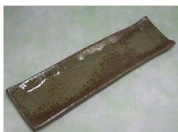
456 53-190227 在庫55 灰釉突出皿(手造り) ¥1,500 23×7cm