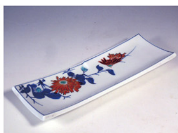
455 58-190203 在庫56 春菊突出皿 ¥1,200 23.5×8.5cm