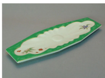
453 52-190306 在庫26 四君子付皿 ¥1,200 23.5×8.4×1.5cm