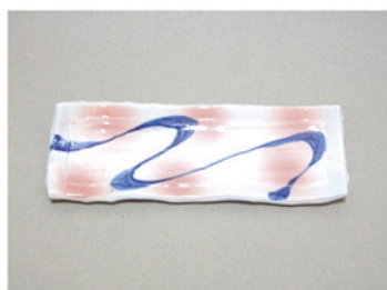
445 21-190310 在庫60 ピンクぼかし流水突出皿 ¥1,700 24.5×8.5×3cm