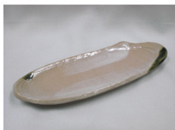
450 75-190234 在庫56 織部桜志野突出皿 ¥600 24×8.2×1.8cm