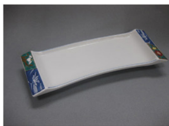
446 20-190302 在庫38 金花アヤマ末広突出皿 ¥1,450 24×9.5×3cm