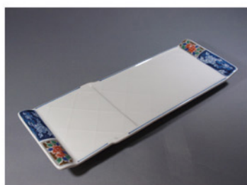
442 55-190127 在庫85 間取金牡丹突出皿 ¥1,300 25.0×9.5×2.0cm