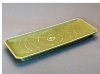
457 52-190102 在庫53 益子渦付皿(強化) ¥1,300 22.8×8.4×2.5cm