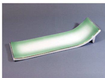
443 55-190261 在庫36 ヒワ測金片上り突出皿 ¥1,500 25.0×7.8×4.5cm