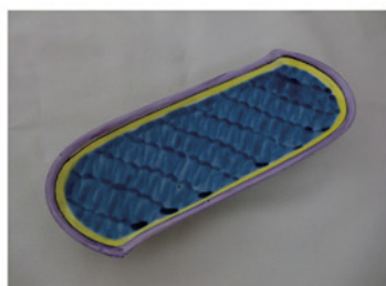
451 75-190331 在庫144 ダミ二色交趾突出皿 ¥500 24×9.5×2.5cm