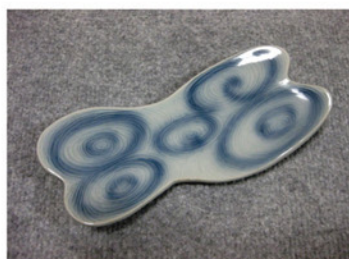
452 20-190211 在庫66 雲型呉須渦四ツ足前菜皿 ¥1,550 23.5×10×3.5cm