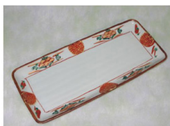
454 53-190213 在庫37 赤絵乾山突出皿 ¥1,450 23.5×10.5×2.3cm