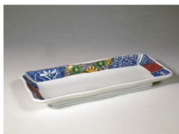
448 57-190312 在庫35 西陣突出皿 ¥1,300 24×10×3.3cm