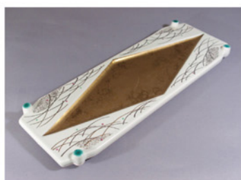
441 55-190151 在庫58 金箔八つ橋突出皿 ¥2,300 26.6×9.4×1.6cm