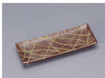
458 75-190308 在庫24 南蛮アミ織部突出皿(小) ¥700 21.8×7×2cm