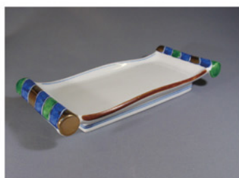
459 55-190180 在庫88 三彩交趾突出皿 ¥1,700 21.5×9.0×3.5cm