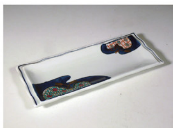
460 57-190304 在庫145 染錦ひさご突出皿 ¥1,700 21.3×9×2cm