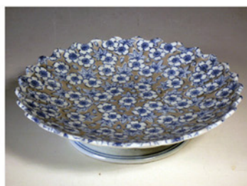
467 58-190205 在庫55 銀彩春秋菊型6.5皿 ¥2,500 20×5cm