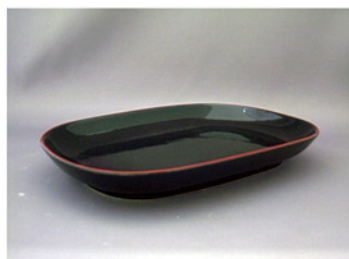
474 03-200231 在庫90 レッドライン多用皿 ¥800 23.4×15.3×3.2cm