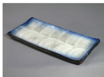
464 72-190318 在庫12 蒼空7.0突出皿 ¥980 20.7×10.2×1.5cm