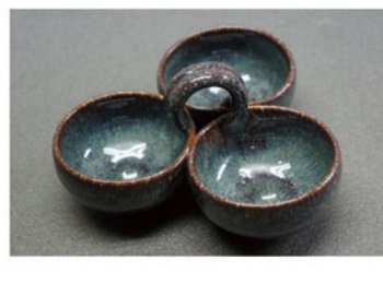
476 91-200311 在庫180 天目窯変三品盛(信楽焼) ¥2,800 14×13×7cm