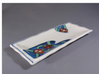
461 55-190183 在庫160 染錦山茶花突出皿 ¥2,200 21.0×9.0×2.0cm