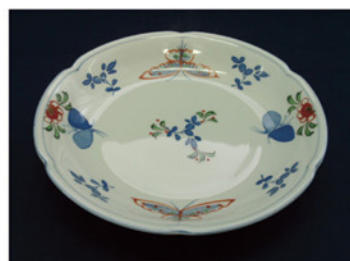
468 55-190307 在庫80 古染蝶花型6.0皿(強化) ¥1,050 18.5×3.5cm