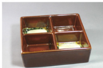
479 72-200301 在庫13 錆四つ切鉢 ¥960 11.4×11.4×3.5cm