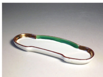
466 28-190104 在庫198 松型突出皿 ¥1,500 20×7×2cm