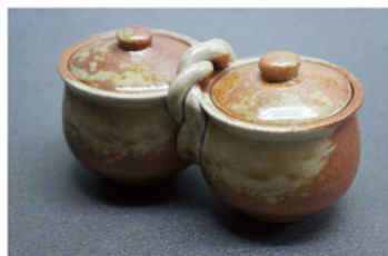
477 91-200312 在庫44 信楽ビードロ蓋付二品盛(信楽焼) ¥3,900 14×7.2×7.5cm