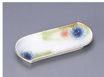
472 75-190326 在庫56 花模様突出皿 ¥1,000 14×9.3×2.8cm