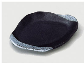
471 75-190327 在庫62 白流し黒水晶タミ二色交跡 ¥1,000 14.5×12.8×3cm