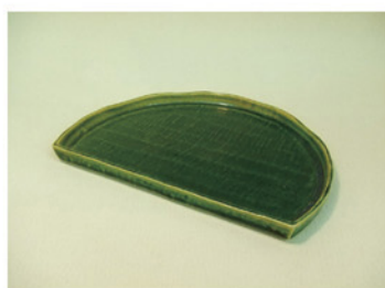
462 71-190321 在庫45 織部半月皿 ¥1,000 21×14.7×1.7cm