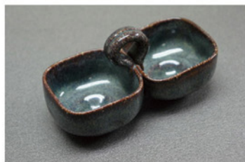
478 91-200310 在庫107 天目窯変角二品盛(信楽焼) ¥2,650 13.5×7×7cm