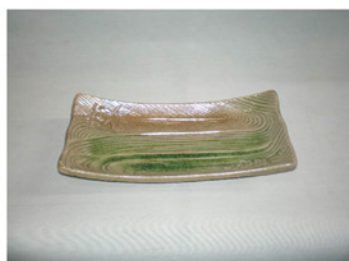
465 37-190378 在庫18 織部流し突き出し ¥700 20.5×10×3.5cm