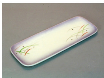
463 52-190218 在庫45 紫吹武蔵野付出皿 ¥800 20.7×8×1.3cm