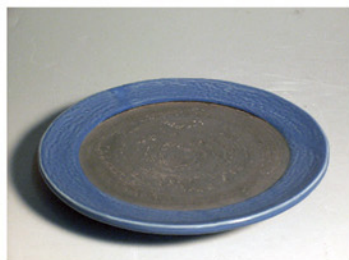
469 58-190109 在庫55 ルリ銀彩6.0丸皿(強化) ¥2,200 18×2.5cm