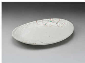
475 25-200213 在庫93 唐草楕円皿 ¥1,350 21×15×2.5cm