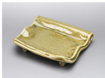
470 52-190354 在庫400 灰釉イラボ折り重ね前菜皿(輪) ¥900 15.5×13.4×3cm