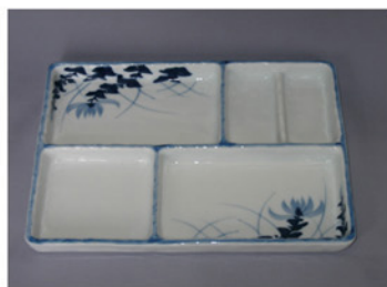
473 72-200106 在庫22 菊絵弁当皿 ¥1,980 27.5×20×2.5cm